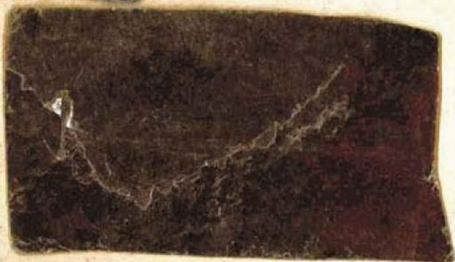
Mica bloc du Madagascar Qualité dur -1° choix grade 3