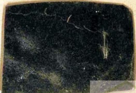
Mica bloc du Madagascar grade 6